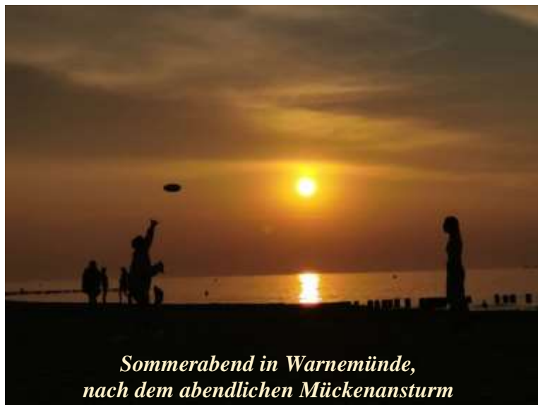
Sommerabend in Warnemünde, nach dem abendlichen Mückenansturm

Im Laufe des Jahres wurde die Umsetzung einer zweiten WG konkretisiert. Die Räumlichkeit war da: Baselerstraße 67. Es war klar, es sollte das gleiche Konzept sein. Des Weiteren kamen wir zu dem Schluss – im Sinne des bestmöglichen Wissenstransfers – unser Team aufzuteilen. Kein allzu leichter Entschluss, denn das bedeutete ein Abschied von geschätzten Kolleg*innen sowie ein verfrühter Abbruch der Betreuung der Bewohner*innen, im Speziellen von den Bezugsklient*innen. Wir teilten die anstehende Veränderung so offen wie möglich mit den Bewohner*innen. Unsere Motivation war, eine Trennungssituation zu schaffen, in der jegliche Emotionen sein dürfen, eine Situation, die möglichst wenig von Kontrollverlust geprägt ist.