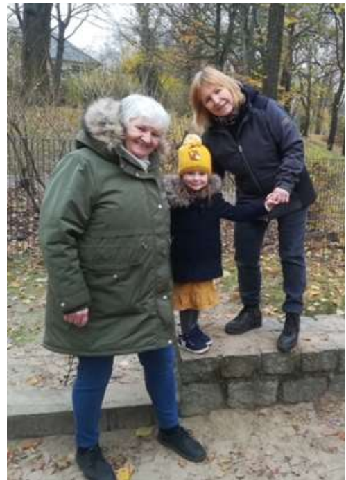
Auch die Schulung einzelner Paten fand im Rahmen längerer Spaziergänge statt.